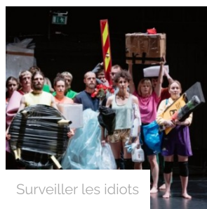
Surveiller les idiots