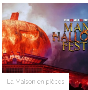
La Maison en pièces