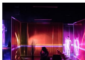
Trop de risques tue le risque